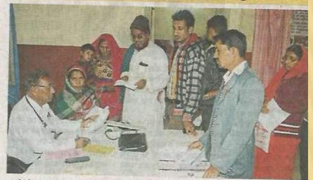
बाइमेर के राजकीय अस्पताल की ओपीडी में वैकल्पिक व्यवस्था में लगे चिकित्सक कर रहे मरीजों की जांच।