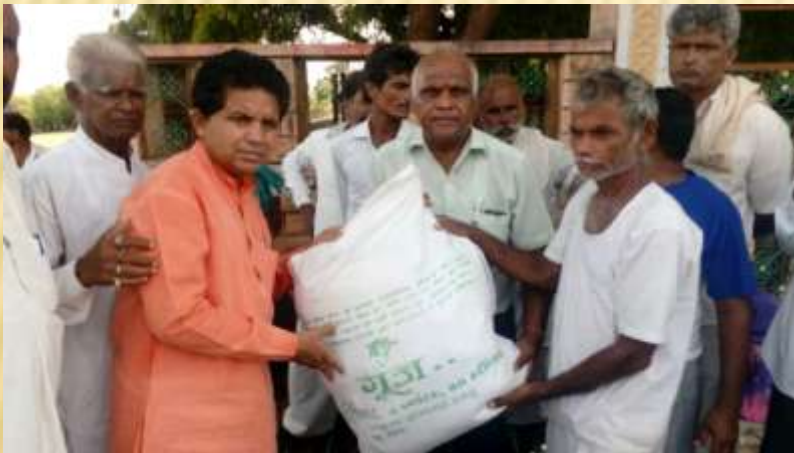
Cloth Distribution among rural poor