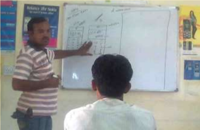
Skill Development Program