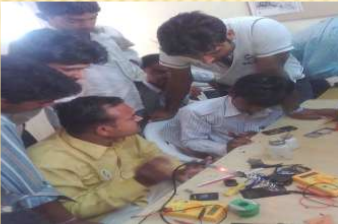
Mobile Repairing Training