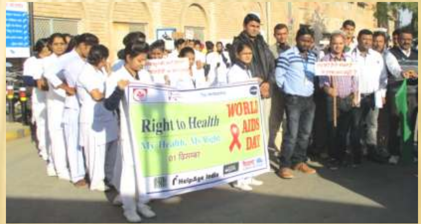
Mass awareness rally on World AIDS Day