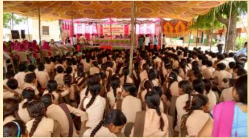
Health Awareness Program