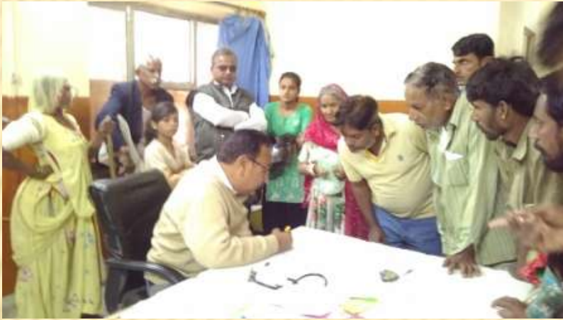
Service to Dist Hospital, Barmer