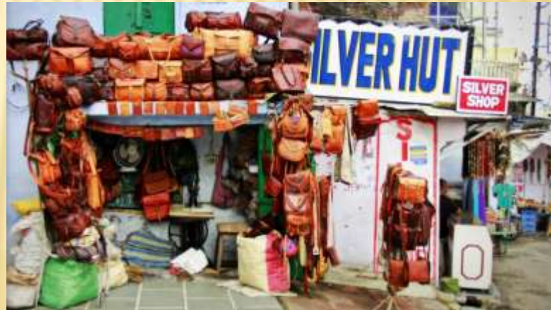
Economic Sustainability through handicraft program