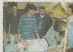
कैम्प से टकराई बाइक में दो छात्र गंभीर घायल हुए।

जोधपुर में दो छात्रों की बाइक से कैम्प में भिड़त होने से गंभीर घायल हुए। जोधपुर में दो छात्रों की बाइक से कैम्प में भिड़त होने से गंभीर घायल हुए। जोधपुर में दो छात्रों की बाइक से कैम्प में भिड़त होने से गंभीर घायल हुए। जोधपुर में दो छात्रों की बाइक से कैम्प में भिड़त होने से गंभीर घायल हुए। जोधपुर में दो छात्रों की बाइक से कैम्प में भिड़त होने से गंभीर घायल हुए।