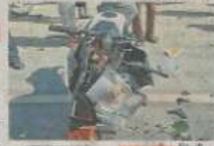
बाइक से भिड़ी बोलेरो में दो छात्र गंभीर घायल हुए।

जोधपुर में दो छात्रों की बाइक से बोलेरो में भिड़त होने से गंभीर घायल हुए। जोधपुर में दो छात्रों की बाइक से बोलेरो में भिड़त होने से गंभीर घायल हुए। जोधपुर में दो छात्रों की बाइक से बोलेरो में भिड़त होने से गंभीर घायल हुए। जोधपुर में दो छात्रों की बाइक से बोलेरो में भिड़त होने से गंभीर घायल हुए। जोधपुर में दो छात्रों की बाइक से बोलेरो में भिड़त होने से गंभीर घायल हुए।